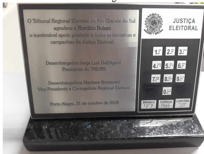
Placa de homenagem – verso: