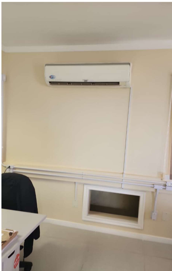
Foto 01: Evaporadora de equipamento listado na tabela do item 3.1.