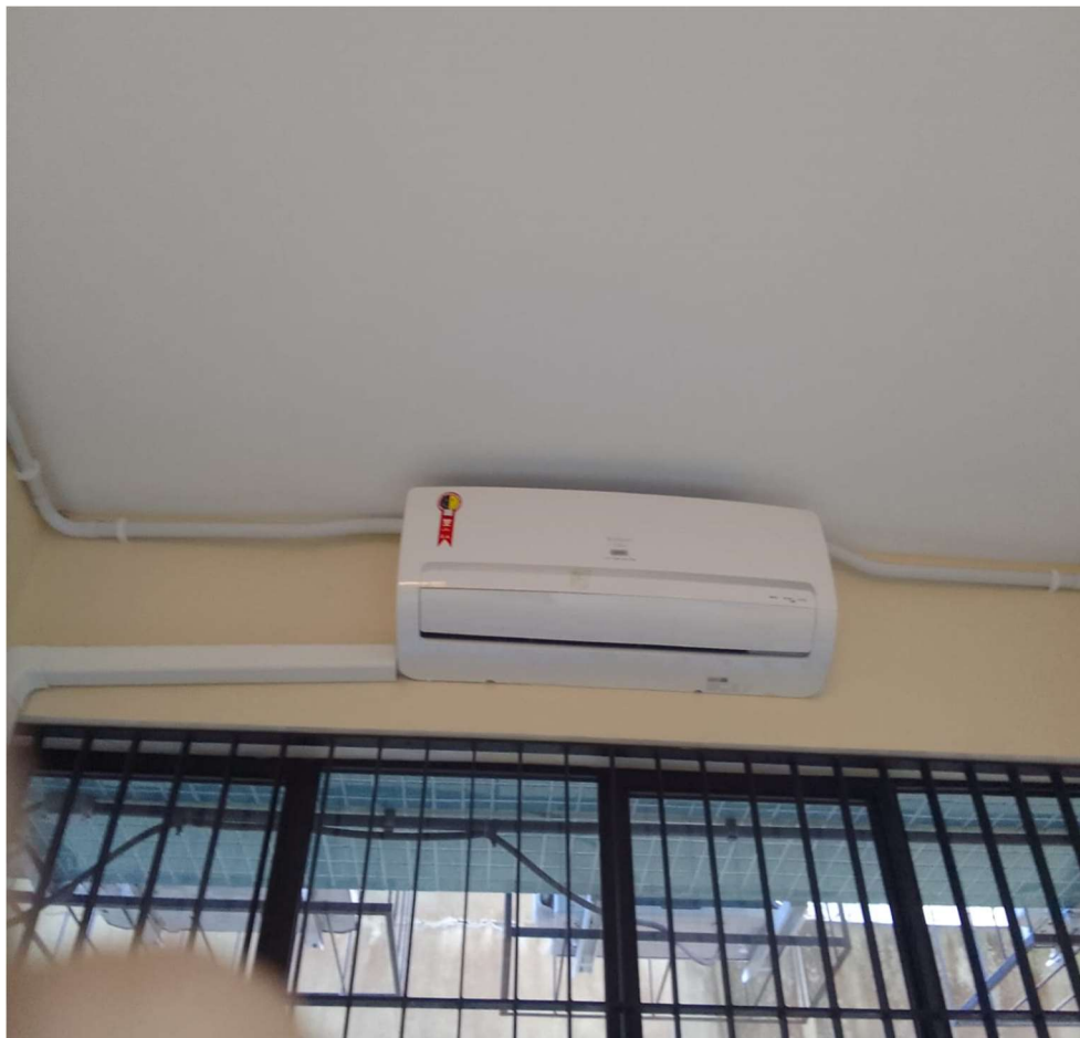
Foto 05: Evaporadora de equipamento listado na tabela do item 3.1.