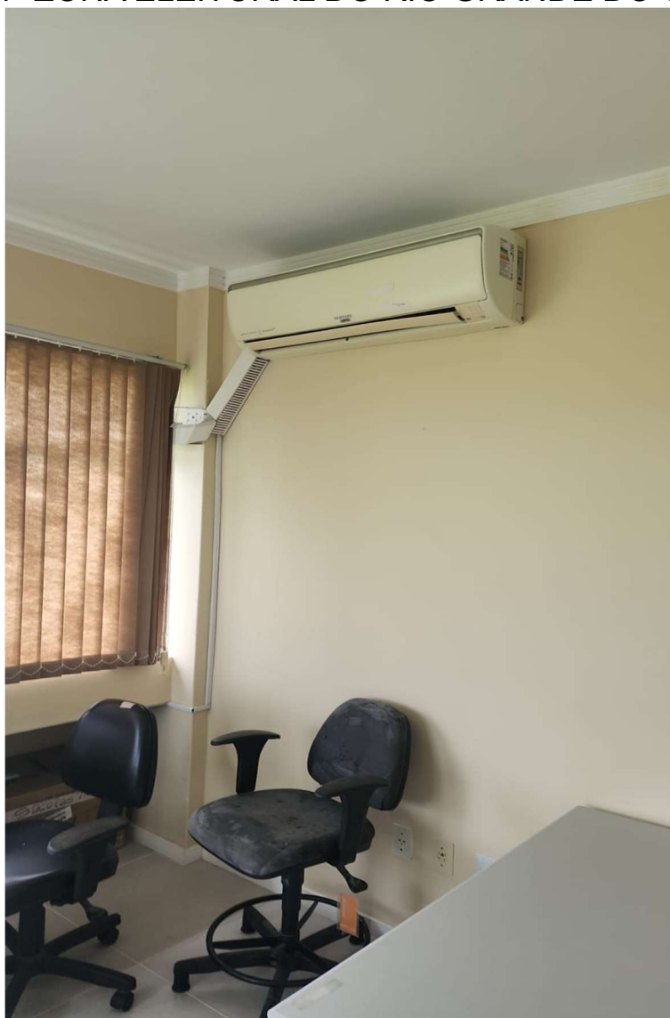
Foto 06: Evaporadora de equipamento listado na tabela do item 3.1.