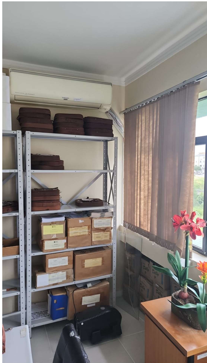
Foto 04: Evaporadora de equipamento listado na tabela do item 3.1.