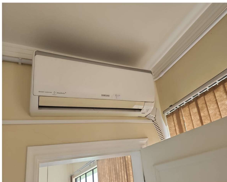
Foto 02: Evaporadora de equipamento listado na tabela do item 3.1.