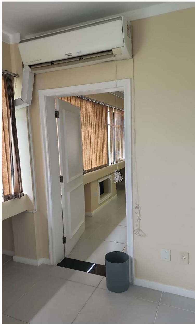
Foto 03: Evaporadora de equipamento listado na tabela do item 3.1.