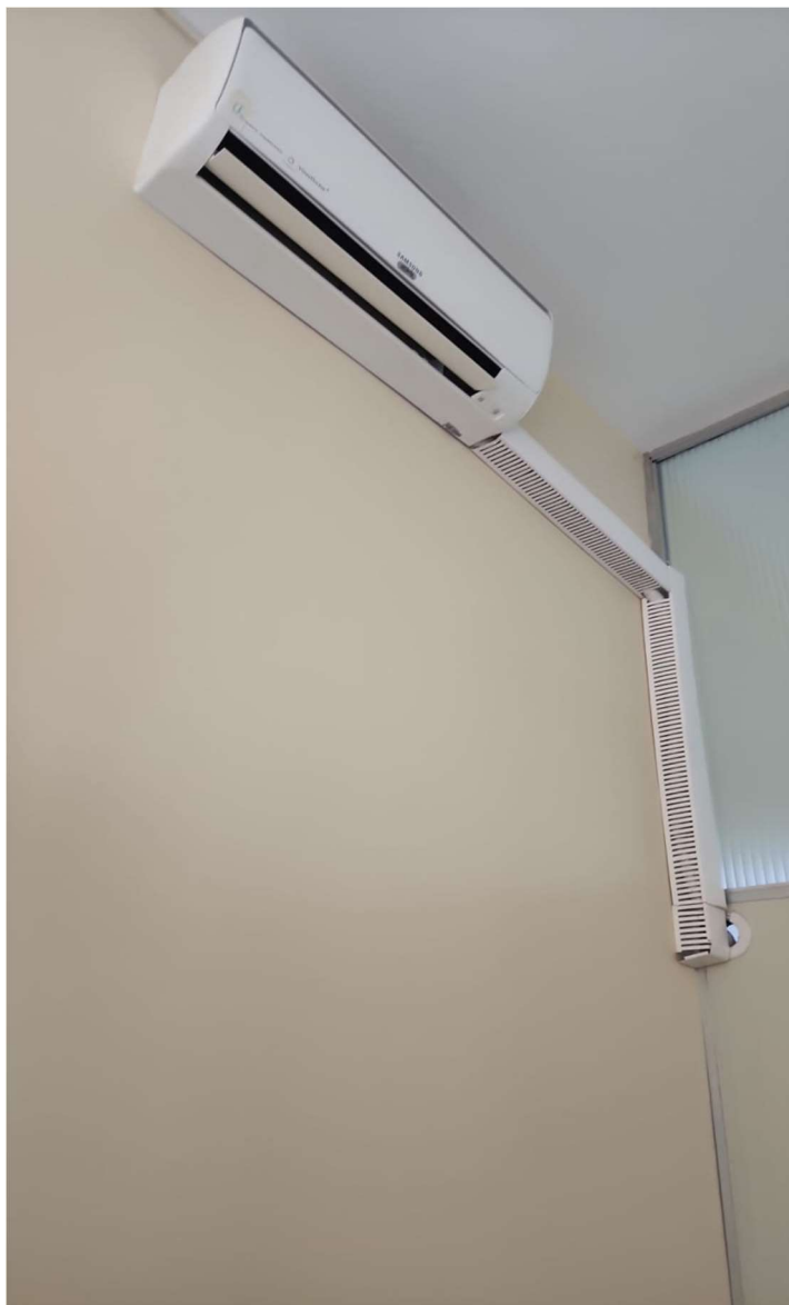
Foto 07: Evaporadora de equipamento listado na tabela do item 3.1.